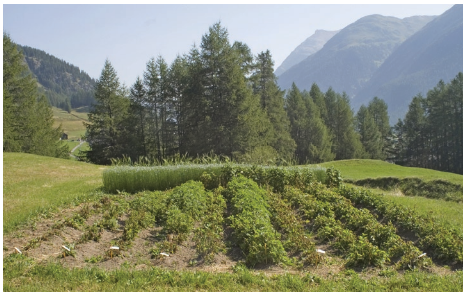
Samedan 24.08.2011, 1700 m.ü.M.. Die Kartoffelsorten litten sehr unterschiedlich unter den Nachfrösten.

Am Sonnenhang von Samedan verläuft der Naturpfad La Senda. Es ist ein Wanderweg durch die Landschaft um Samedan. Direkt oberhalb des Dorfes sind noch alte Bewässerungsgraben sichtbar. Anschliessend führt der Weg durch ein kleines Wäldchen direkt an einem kleinen Acker vorbei. Im Sommer kann man hier u.a. Winterroggen, Sommergerste, Kartoffeln, und Flachs bewundern. Die Wanderzeit beträgt ungefähr 2.5 Stunden. Der Weg bietet verschiedene Attraktionen u. a. eine gekoppelte Schaukel ( http://www.bio-divers.ch ). Das Feld befindet sich in der Grenzregion des Ackerbaus, was sich 2011 deutlich bei den Kartoffeln zeigte. Diese litten unter den Barfrösten. Nicht alle Sorten litten gleich stark, es gab erstaunliche Unterschiede zwischen den Sorten. Ertragreich waren Maikönig, 8-Wochen-Nudeli, Prät-