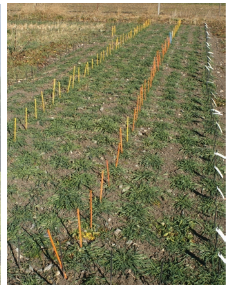
Ardez 24.11.2011. Cadi, die Auslese geht gut bestockt in den Winter.

In Versuchsfeldern in Alvaneu und Ardez wird an der Verbesserung der Standfestigkeit des Cadi Roggens gearbeitet.