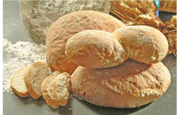
Paun jauer, eine Brotsorte die zum kulinarischen Erbe der Schweiz gehört.

tigauer Müsli und der Wiesner aus Zillis. Auffallend gross waren die Knollen der Sorte Wiesner, sie waren drei mal so gross wie jene ihrer Schwestersorte Parli. Die Kartoffeln litten nicht unter Krautfäule wie in Alvaneu und Ardez. Ein Teil des Winterroggens wurde bereits Ende Mai 2011 gesät und wird erst in September 2012 geerntet werden können. Der Schaugarten in Ardez gibt es ab 2012 nicht mehr. Es kamen zu wenig Besucher. Ein Schaugarten ist sinnvoll, wenn er eingebettet ist in einem grösseren Projekt. Wir suchen noch nach einem geeigneteren Standort.