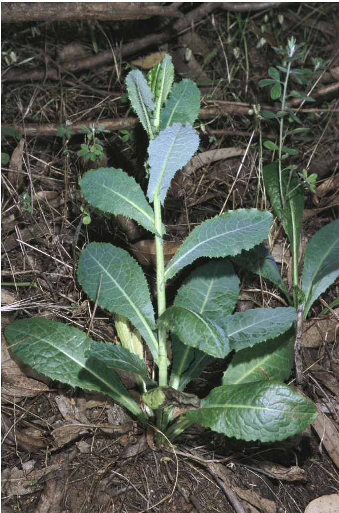
Abb. 5 Eine junge Pflanze eines Stachellattichs mit ganzrandig bleibenden Blättern.