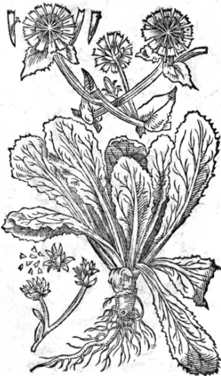
Endivien. Endivia. Intybus fatiuis. Große krause Endivien. Endivia crispa.