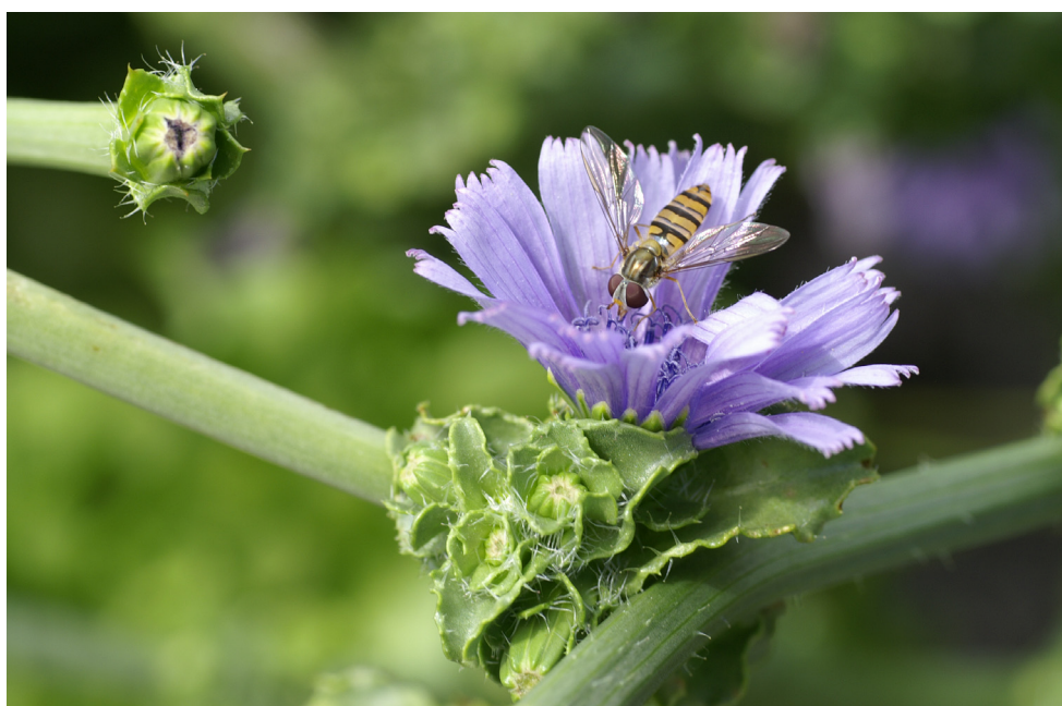
Endivienblüte mit Schwebefliege. 25.07.2013.