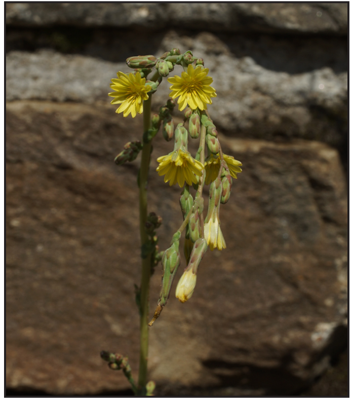
Abb. 1 Blühender Stachel-lattich oder Kompasspflanze ( Lactuca serriola ). Die Hüllblätter bilden einen Kelch, sie regeln das Öffnen und Schliessen der Blüte. Die Kompasspflanze ist die wilde Verwandte des Lattichs und kommt in der Schweiz häufig vor. Das hier gezeigte Exemplar wuchs in der Mauer unseres Gartens. 21.08.2019

Der wilde Salat ( Lactuca serriola ) ist unter den Namen Kompasspflanze und Stachellattich bekannt (Abb. 1 und 3). Serriola – scariola – escarius heisst essbar. Man findet ihn von der Atlantikküste Nordafrikas bis nach Somalia und in Westeuropa über die Nordseeküste, mit Ausnahme von England, bis nach Südwestsibirien und Zentralchina (Kew Plants of the World Online, 14.08.2024). Bei der Endivie und bei Zichorie handelt es sich um zwei nah verwandte Kulturpflanzen, die aus unter-