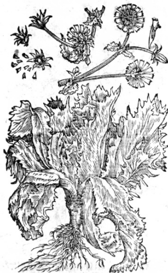
Abb. 10 Links Eskariol ( C. endivia var. latifolium ), rechts krausblättrige Endivie ( C. endivia var. crispum ), wie in Abb. 23 aber mit Betonung der Rosetten. Rechts oben ein geschlossenes Köpfchen kurz vor der Blüte. Links oben die inneren Hüllblätter geben die Samen frei. Mattioli, Camerarius 1586