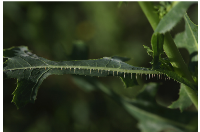
Abb. 3 Stachellattich, auch Kompasspflanze genannt. Links ein Blatt dass sich vertikal ausgerichtet hat. (04.08.2024). Rechts: Insbesondere die Hauptnerven der Blätter bilden die Stacheln aus. (14.08.2024)

subsp. divaricatum ), die von der Atlantikküste und Nordafrika bis nach Persien und Xinjiang (China) heimisch ist (Kew Plants). Sie kommt nicht so weit im Norden vor wie die Wegwarte.