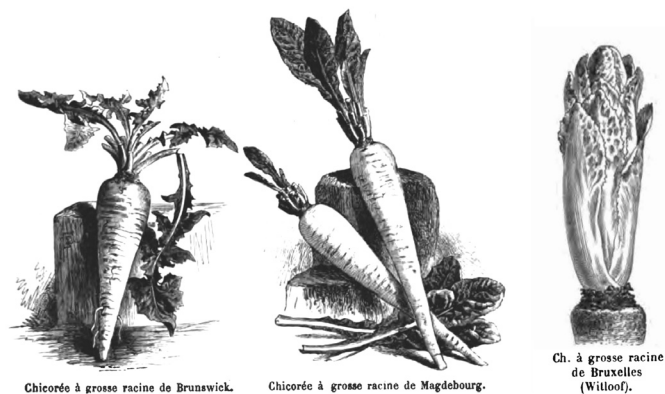
Abb. 11 Im 18. und 19. Jahrhundert erlebte der Anbau der Zichorienwurzel ( C. intybus var. sativum ) einen Höhepunkt. Im Laufe des 19. Jahrhundert entdeckte man, dass lange im Dunkeln und warm gelagerte Wurzelzichorien delikate Blätter treiben, die in den Städten einen guten Absatz fanden. Vilmorin 1883