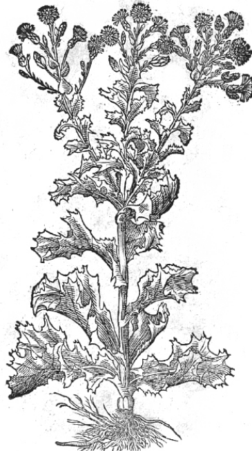
Krauser Endivien Lattich.