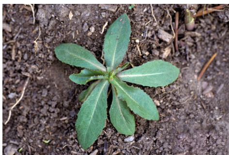
Abb. 4 Rosette einer besonderen Form des Stachellattichs. Die Blätter sind ganzrandig, Einbuchtungen fehlen. In Ägypten wurde vor mehr als 4'500 Jahren aus solchen Formen die ersten Kulturpflanzen gezogen. Die Aufnahme stammt aus Amerika, dort ist die Pflanze ein Neophyt und gehört zu den invasiven Arten.

Die Zichorie ist vermutlich später entstanden als die Endivie. Die Wegwarte, ihre wilde Verwandte, diente im klassischen Altertum als Arzneipflanze. Zichorie und Endivie sind schwer zu unterscheiden, die Beschreibungen aus der griechischen und