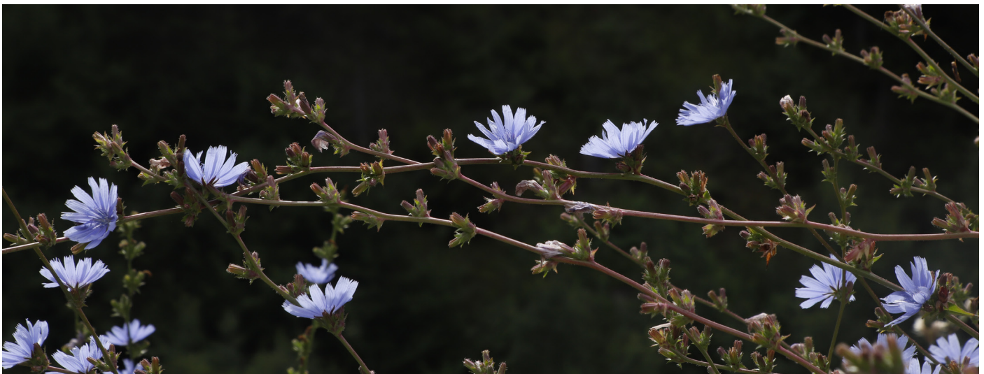
Abb. 2 Blühender Zweig der Wegwarte gerade von den Sonnenstrahlen berührt. Die Blüten reagieren sofort. Nach einem Tag sind sie verblüht, jeden Tag blühen andere Köpfchen. Die Wegwarte ist die wilde Verwandte der Zichorie. 08.08.2024

schiedlichen Wildpflanzen hervorgegangen sind. Die wilde Verwandte von Zichoriensalat, Zichorienwurzel, Radicchio und Chicorée ist die Wegwarte ( Cichorium intybus ) (Abb. 2). Die wilde Wegwarte ist mit Ausnahme von England und Irland in ganz Europa einheimisch, man findet sie bis nach Zentralasien im Westhimalaya (Kew Plants). Die Endivie ( Cichorium endivia subsp. endivia ) kennt zwei Hauptformen: den breitblättrigen Eskariol (var. latifolium ) und die krausblättrige Endivie (var. crispum ) (Abb. 9 und 10). Ihre wilde Verwandte ist die Niedrige Wegwarte ( Cichorium pumilum = Cichorium endivia