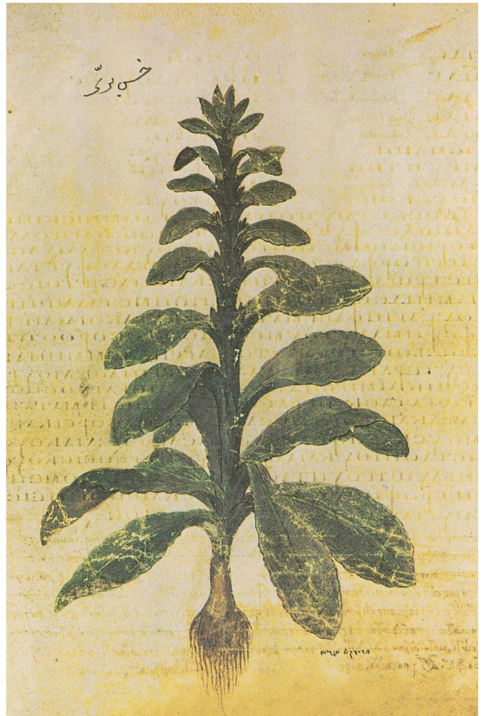
Abb. 6 Sprossender Lattich. Der Spross erinnert stark an dem ganzrandigen Stachellattich in Abb. 5. Der Illustrator hat die Blätter zwar in eine Reihe, aber nicht versetzt, sondern paarweise angeordnet. Die Römer assen nicht nur die Blätter, siehe Abb. 7, sondern auch den jungen Stängel. Die Wurzel ist der Phantasie des Illustrators entsprungen, sie erinnert eher an die Wurzel einer Zwiebel. Dioskurides (512) © ÖNB Wien: Cod. Med. Gr. 1 137r